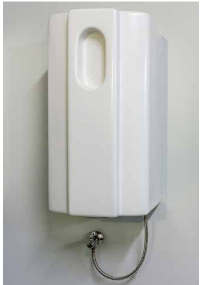
STEAMSTAR BASIC und STEAMSTAR POWER